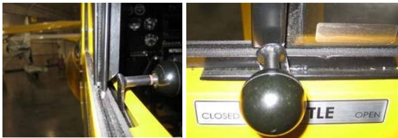
图 1-后窗手柄导槽/油门杆受阻碍